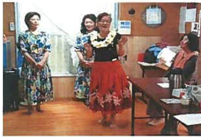
オレンジクラブの皆さん

去る4月26日・5月9日に、西原町の各自治会で行われている「いいあんべー共生事業」と、社会福祉センターの「お元気ですか事業」に、いいあんべー家で活動を行っている『フラダンスサークル』と『オレンジクラブ(卓球)』の皆さんにボランティアとして協力していただきました。