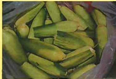
届けられたとうもろこし

出荷できないといっても味は一級品です。とてもおいしい素敵な贈り物をいつもありがとうございます。