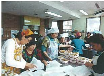
→レファ・フラサークルの皆さん

現在いいあんべー家では、8つのサークルが『健康づくり・生き甲斐づくり及び地域等でのボランティア活動』を目的として、日々熱心に活動を続けております。