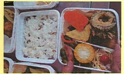
提供された野菜で作った弁当