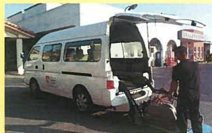
車イスに乗ったまま乗り降りできるリフト付車両