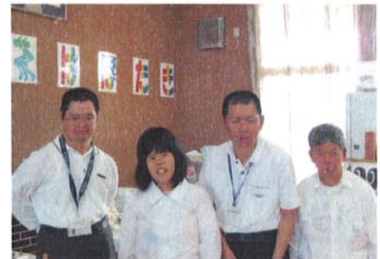
はばたき喫茶班の皆さん

※お得なコーヒー券（6枚綴り）1,000円・ジュース券（5枚綴り）700円も販売しております。