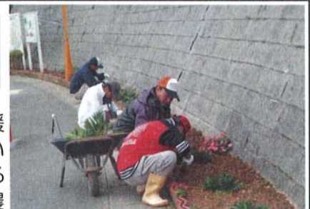
花だんづくり作業の様子

※利用に関しては、障害福祉サービス受給者証が必要となります。詳しくは下記までお問い合わせ下さい。