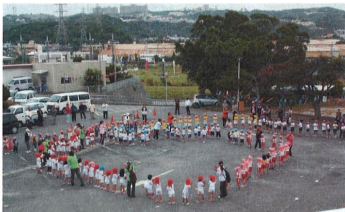
鯉のぼり掲揚式の様子