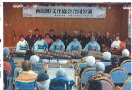
合同公演会の様子

会場には、デイケア利用者様 約40名、施設利用者様 50名、その他ご家族様、職員合わせて約120名余りの観客の中、公演がスタートしました。今回は、東北地方太平洋沖地震の為、被災地の皆様に黙祷をささげ 早期の復旧・復興を願った。琴、三味線、太鼓、舞踊 合同の公演で幕が開く度に大きな声援、拍手があり会場を魅了しました。公演していただいた皆様、ありがとうございました。