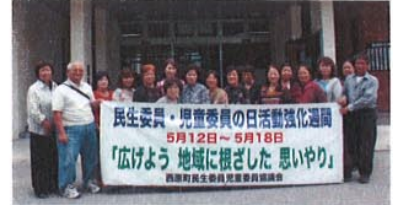
第2民生委員児童委員の皆さん

総合相談所 [西原町社会福祉センター内] TEL835-8822 FAX 946-6777