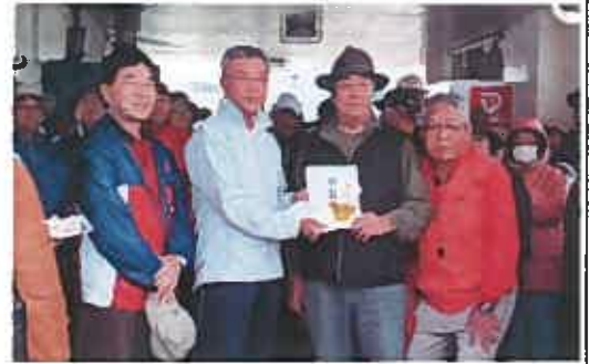
歳末助け合い募金へ