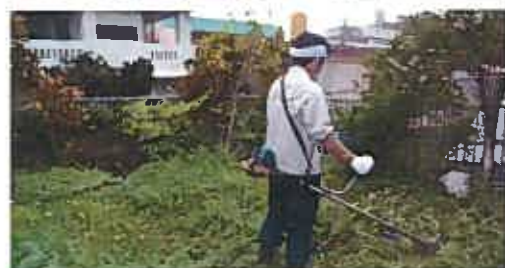
草刈り作業の様子