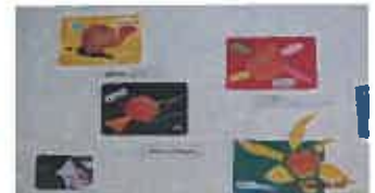
臨床美術体験教室の様子と展示作品